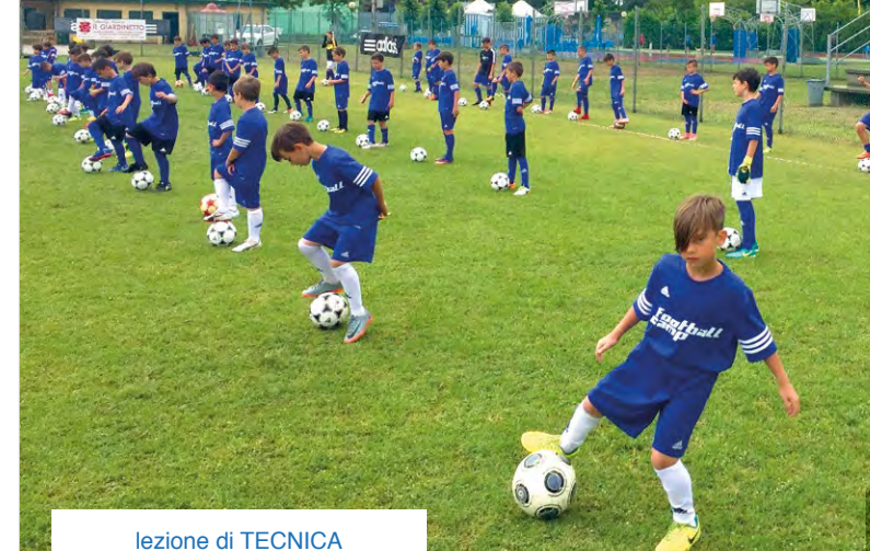
lezione di TECNICA