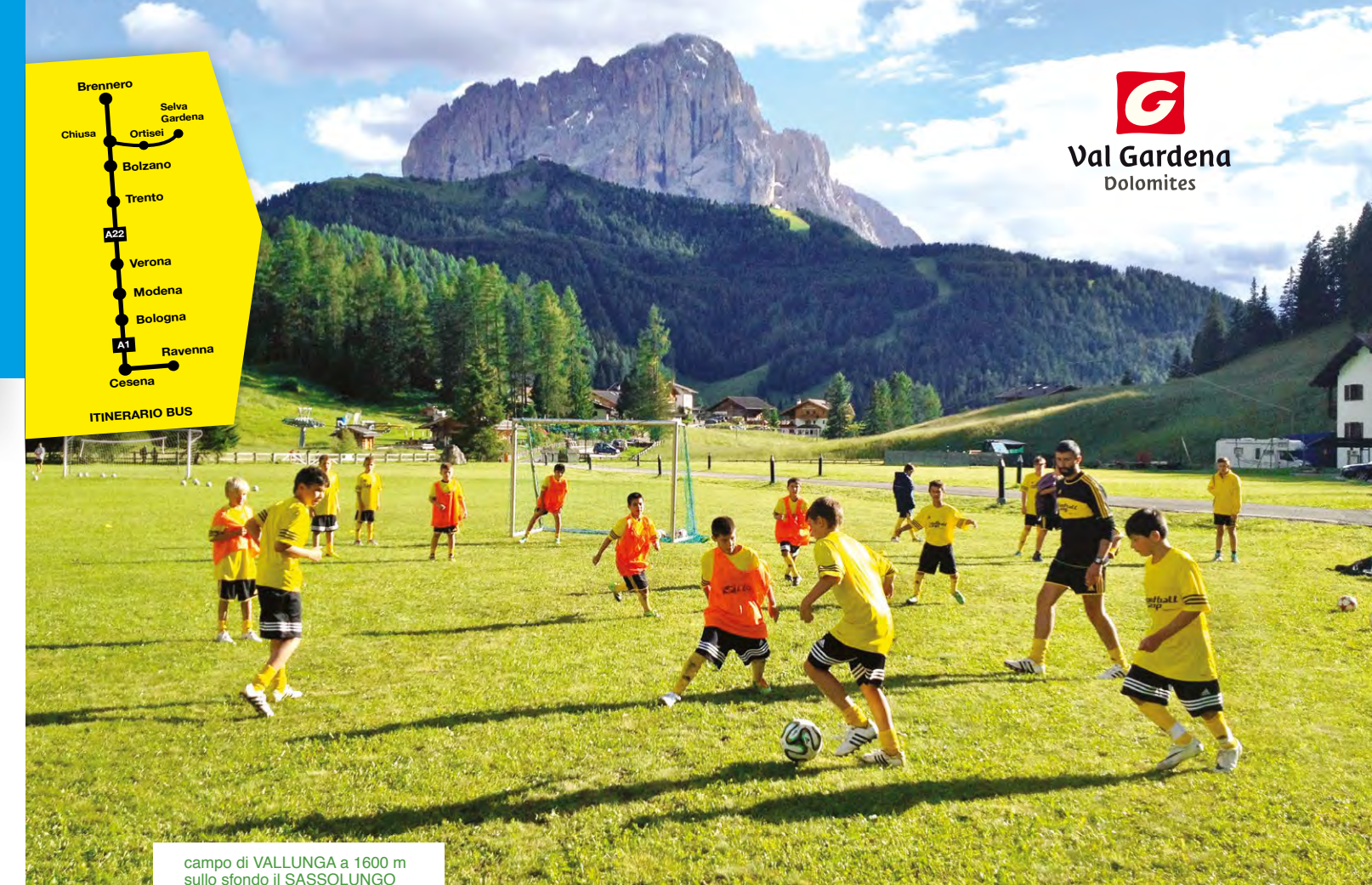
campo di VALLUNGA a 1600 m sullo sfondo il SASSOLUNGO