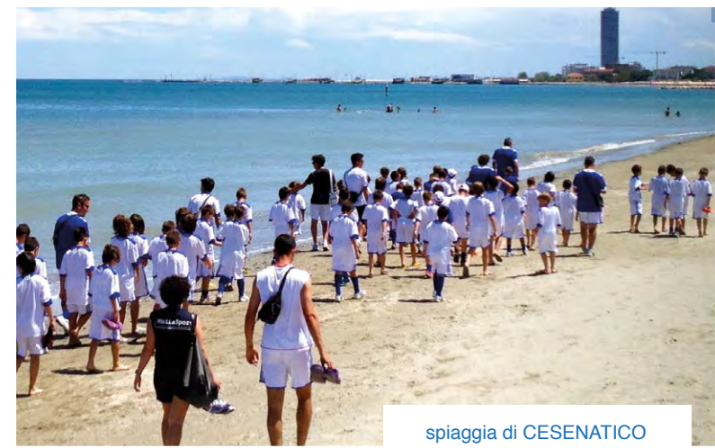
spiaggia di CESENATICO