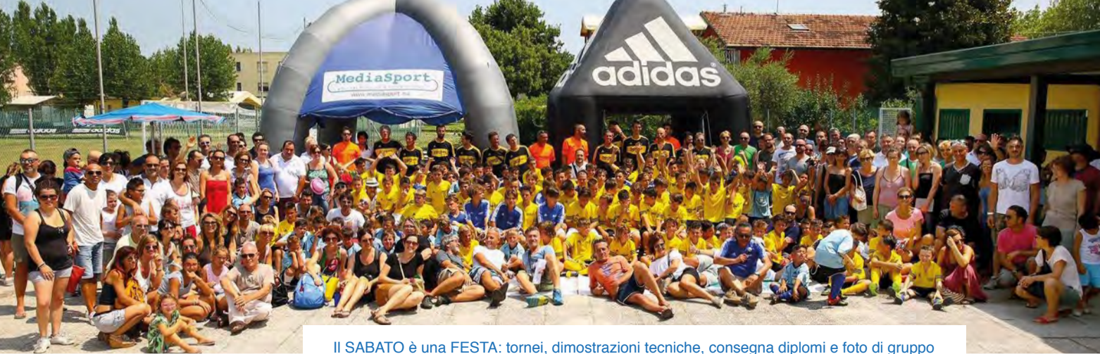
IL SABATO è una FESTA: tornei, dimostrazioni tecniche, consegna diplomi e foto di gruppo