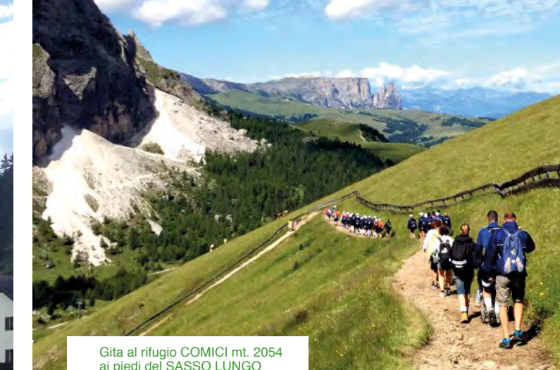
Gita al rifugio COMICI mt. 2054 ai piedi del SASSO LUNGO