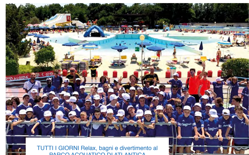
TUTTI I GIORNI Relax, bagni e divertimento al PARCO ACQUATICO DI ATLANTICA

* per chi intendesse utilizzare il servizio di trasporto per Cesenatico A/R al costo day camp dovrà aggiungere euro 20 bus fino ad esaurimento posti disponibili