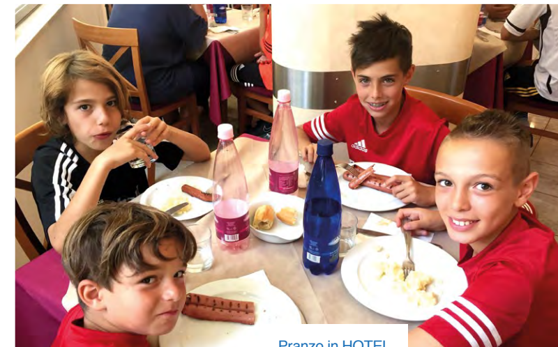
Pranzo in HOTEL